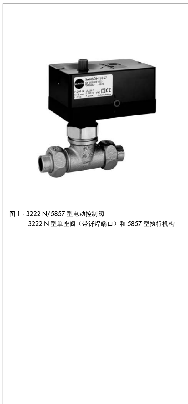
图 1 · 3222 N/5857 型电动控制阀 3222 N 型单座阀（带钎焊端口）和 5857 型执行机构